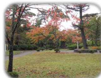
おや、きれいーだごと!