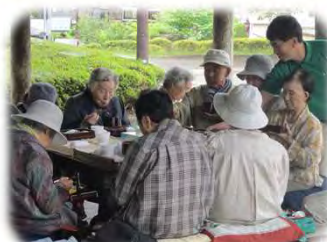
みんなで食うと、うめ～！