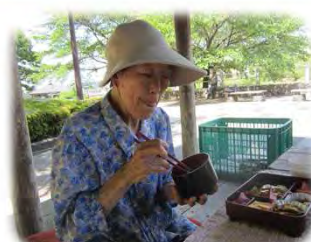
外で食うのもいいな～！