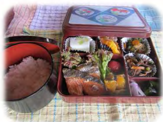
のぞみ特製 鮭弁当！

6月の下旬から7月の初旬にかけて、ピクニックに行きました！ 弁当とお茶をもって、目指すは一つ森公園♪ 暑い日、寒い日、風の強い日と、気候はまさに梅雨真っ只中(^_^) 参加されたご利用者様からは、「楽しかったよ！」「次はどこに行く！」「やっぱり外で食べるご飯は、おいしいな！」との声を頂きました!(^)!