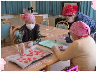
初めてのクッキー作り♪

3月3日、ケアホテルのぞみでは「ひな祭り茶会」を開催致しました。ご利用者様皆様と一緒にイチゴフルーチェと、桃の花をイメージした花形のクッキーを作り、15時のおやつ時間に皆さんでひな祭りの歌を聴きながら茶話会を開きました。皆さんで協力しながら作業を行い、「いい記念になったし、自分で作ったおやつは格別に美味しい！」と楽しまれておりました。